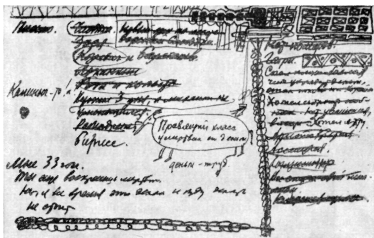
Заметки к «Золотому теленку»

Этот листок много месяцев пролежал в бумагах писателей, прежде чем они снова вернулись к роману. А вернувшись, они взяли и этот начатый лист и сделали на нем еще ряд любопытнейших записей. Одна из них весьма точно выдает время, когда был дописан лист: «Визит Остапа к Рабиндранату Тагору» (в романе это преобразилось в главу «Индийский гость»); а Тагор был в СССР только однажды — с 11 по 25 сентября 1930 г. Среди «Подробностей» эта запись ничем не выделяется, и, занося ее, авторы, вероятно, еще не предполагали, что этот эпизод станет одним из существенных в сюжете. За ним идут обычные, характерные для Ильфа и Петрова заметки: «Концессия на снятие вывесок»; «Цепь огня. Прикуривание»; «Люди ездят в командировки»; «Сказочка о кошках и тракторах, или о том, как в городе Н. наступил рай»; запись: «О правдолюбцах, которые хотят, чтобы люди были ангелами, и которым ничего не стоит растоптать человека. С отыгрышем о первых учениках. Аллилуйшики». «Отыгрыш о первых учениках» — излюбленный у Е. Петрова. В октябре того же года писатель воспользовался им в фельетоне «О первых учениках» (где речь шла, разумеется, не о первых учениках, а о