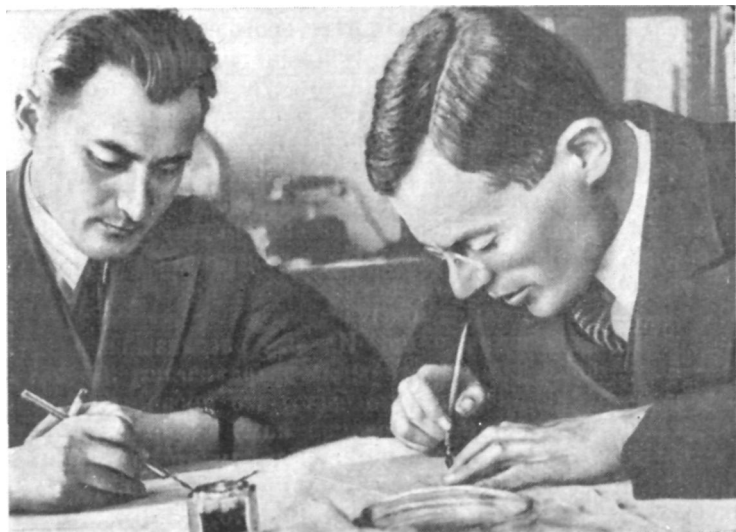
Илья Ильф и Евгений Петров за работой

Такова внешняя картина творчества Ильфа и Петрова. А сущность их соавторства? Что вносил в общее творчество каждый из писателей, что получила литература в результате такого своеобразного слияния двух творческих индивидуальностей? Попробуем ответить на этот вопрос, обратившись к предыстории творчества Ильфа и Петрова, к тому времени, когда возникли и существовали раздельно два писателя: писатель Илья Ильф и писатель Евгений Петров.