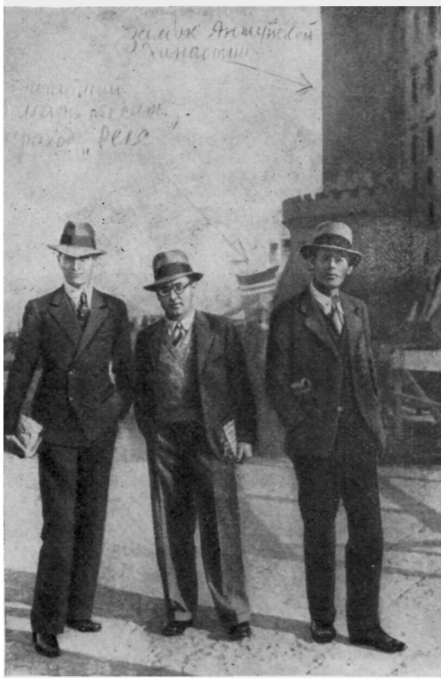
Евгений Петров, Борис Ефимов, Илья Ильф в Неаполе. Ноябрь, 1933 г. (надписи на фотографии сделаны Б. Ефимовым)