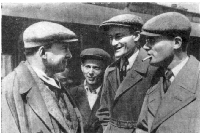
И. Ильф и Е. Петров встречают И. Эренбурга, приехавшего из-за границы. Москва, 1934 г.

и прочно, что произошло это без усилий со стороны критиков и литературоведов.