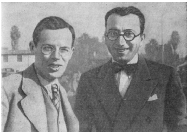
Илья Ильф и американский кинорежиссер Р. Мамульян

кого подвозили писатели, тех, кто помогал им вытаскивать из канавы едва не перевернувшийся автомобиль. С открытой душой принял Ильфа и Петрова Хемингуэй. Он звал их к себе во Флориду — на рыбную ловлю. Они были гостями Эптона Синклера, утверждавшего, что он никогда так не смеялся, как читая «Золотого тельца». Их дружески встретил уже прикованный к постели умирающий писатель Линкольн Стеффенс, только за год до того вступивший в коммунистическую партию. С лучшими голливудскими режиссерами они вели долгие откровенные разговоры, в которых, как перед самыми близкими людьми, раскрывались голливудские «крепостные». В ту же американскую зиму Ильф и Петров познакомились с Полем Робсоном. Это было время, когда впервые установились нормальные отношения между Советским Союзом и Соединенными Штатами с их рузвельтовским правительством.