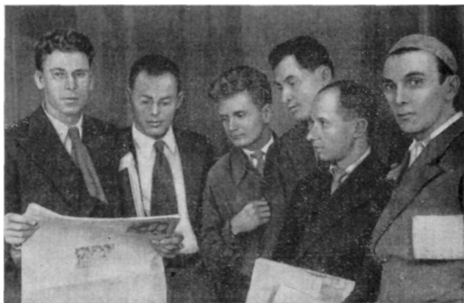
И. Ильф (второй слева), Е. Петров (третий справа), художники Кукрыниксы (М. Куприянов, Н. Соколов, П. Крылов) и А. Архангельский на I съезде писателей. Москва, 1934 г.

объединялись единством темы. Все они явились ответом на апрельские события 1932 г., хотя первые из них стали появляться в печати не после, а в канун постановления. И все они были устремлены не столько назад, в отошедшие рапповские времена, сколько вперед — к завтрашнему дню советской литературы, к ее новому расцвету, началом которого должен был стать I Всесоюзный съезд советских писателей.